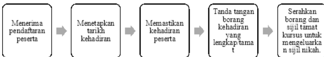
Rajah 2: Rumusan carta alir proses pendendalian Kursus Pra Nikah

Tugas pihak BKNK juga melaksanakan program Kursus Pra-Perkahwinan yang wajib bagi pasangan sebelum mendirikan rumah tangga untuk memberi maklumat serta pendedahan awal kepada bakal suami isteri. Kursus ini dapat meningkatkan kefahaman dan penghayatan ilmu fardhu ain dan fardhu kifayah. Inisiatif ini digerakkan adalah sebagai satu usaha untuk mengurangkan kadar perceraian dan mewujudkan masyarakat yang harmoni. Adapun Kursus Pra Nikah mengandungi beberapa pengisian seperti pensyariatan perkahwinan, hak dan tanggungjawab suami isteri dalam keluarga, krisis rumah tangga dan talaq dan rahsia kebahagiaan rumah tangga. Manakala proses pengendalian Kursus Pra Nikah adalah bermula dari menerima pendaftaran peserta, menetapkan tarikh kehadiran, memastikan kehadiran peserta, menandatangani borang kehadiran yang lengkap dan menyerahkan borang dan sijil tamat kursus untuk mengeluarkan sijil nikah (KHEU, 2021). Proses ini menunjukkan bahawa setiap pasangan perlu menjalani Kursus Pra Nikah untuk mendapatkan sijil nikah mereka. Berikut adalah rumusan carta alir bagi proses pengendalian Kursus Pra Nikah;