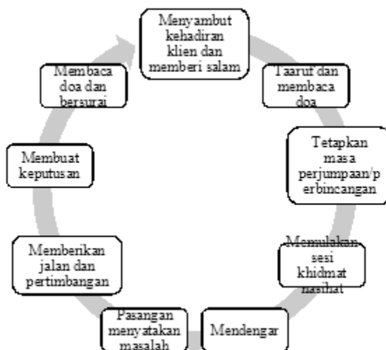
Rajah 3: Carta alir bagi tata cara perjumpaan sesi khidmat nasihat

Berdasarkan carta alir cara perjumpaan semasa sesi khidmat nasihat dijalankan, pegawai khidmat nasihat akan memastikan mendengar masalah pasangan terlebih dahulu kemudian akan memberikan jalan pertimbangan dan penyelesaian yang bersesuaian. Bimbingan seperti ini adalah bertepatan dengan tujuan kaunseling menurut perspektif Islam sepertimana dalam penulisan (Rifda El-Fiah, 2016), yang menyatakan empat tujuan kaunseling iaitu; pertama, membantu individu mengenalpasti