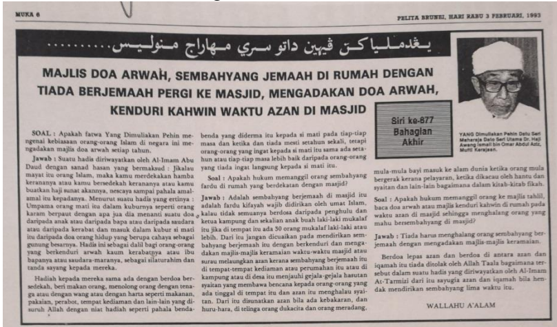
Gambar 6.2: Yang Dimulikan Pehin Datu Seri Maharaja Menulis. (Pelita Brunei; Hari Rabu, 03hb Februari 1993).

Dimulikan Pehin Datu Seri Maharaja Menulis" yang disiarkan pada setiap minggu orang-orang lama di negara ini mengadkan majlis doa arwah setiap tahun. Jawab : Suatu hadis dirwayatkan oleh Al-Imam Abu Daud dengan sanad hasan yang bermaksud : Jika kamu mayat itu orang Islam, maka kamu merdekakan hamba kerannya atau kamu bersedekah kerannya atau kamu buatkan haji sunat akumnya, nescaya sampai pahala amal-amal itu kepadanya. Menurut suatu hadis yang erlanya : Umpama orang mati itu dalam kuburnya seperti orang karam berputar dengan apa itu di minanti suatu doa daripada anak atau daripada bapa atau daripada saudara atau daripada kerabat dan masuk dalam kubur si mati itu daripada doa orang hidup yang berupa cahaya sebagai gunung besarnya. Hadis ini sebagai dalil bagi orang-orang yang berkeduri arwah kaum kerabatnya atau ibu bapanya atau saudara-maranya, sebagai silaturahmi dan tawazuk syarak kepada mereka. Hadiah kepada mereka sama ada dengan berdoa bersedekah, beri makan orang, menolong orang dengan tenaga atau dengan wang atau dengan harta seperti makanan, pakaian, perabot, tempat kediaman dan lain-lain yang di suruh Allah dengan niat hadiah seperti pahala benda-