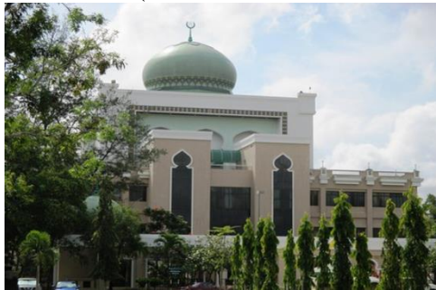
Gambar 3.1: Bangunan Darul’ifta Jabatan Mufti Kerajaan, di jalan Babu Raja. ( www.mufti.gov.bn )

Jabatan Mufti Kerajaan berperanan sebagai pusat rujukan ilmu dan maklumat Islam yang lengkap dengan mengeluarkan Fatwa dan Irsyad. Fatwa dikeluarkan berdasarkan Al-Qur’an, al-Hadits, Ijma’, Qias, Mazhab Syafi’i, Qaul Mu’tamad Mazhab Hanafi, Maliki dan Hanbali, dan ijthad Mufti. (Dewan Bahasa dan Pustaka, 2019).