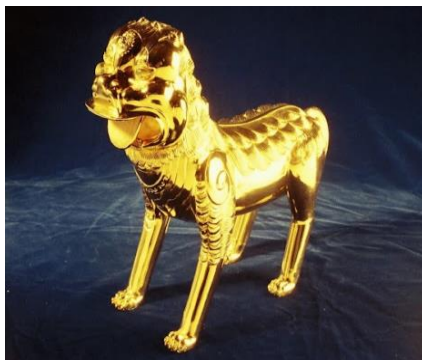
Gambar 6.1: Gambar Bentuk Kucing Emas, Alat Kebesaran Diraja Brunei.