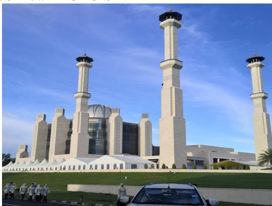
Gambar 10.1: Bangunan Balai Khazanah Islam Sultan Haji Hassanal Bolkiah. Ihsan daripada pengkaji.

Turut diadakan sebagai acara sampingan ialah Ceramah dan Forum Majlis Ilmu 2019 dan acara-acara sampingan iaitu Seminar anjuran UNISSA dan KUPU SB.