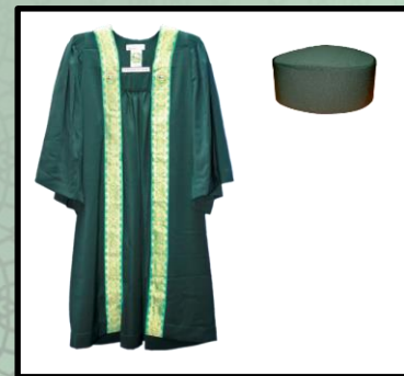
Graduan Diploma tanpa turus