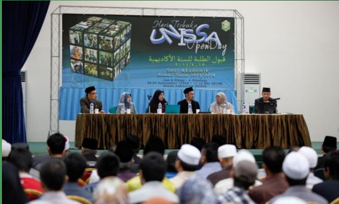
Para dekan dan ketua program memberikan taklimat mengenai fakulti dan program masing-masing