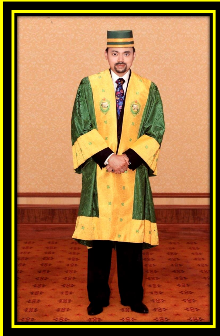
DULI YANG TERAMAT MULIA PADUKA SERI PENGIRAN MUDA MAHKOTA PENGIRAN MUDA (DR.) HAJI AL-MUHTADEE BILLAH IBNI KEBAWAH DULI YANG MAHA MULIA PADUKA SERI BAGINDA SULTAN HAJI HASSANAL BOLKIAH MU'IZZADDIN WADDAULAH, MENTERI KANAN DI JABATAN PERDANA MENTERI PRO-CANSELOR UNISSA