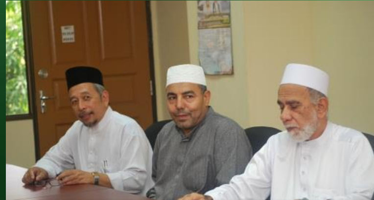
Di antara peserta adalah terdiri dari tenaga akademik UNISSA