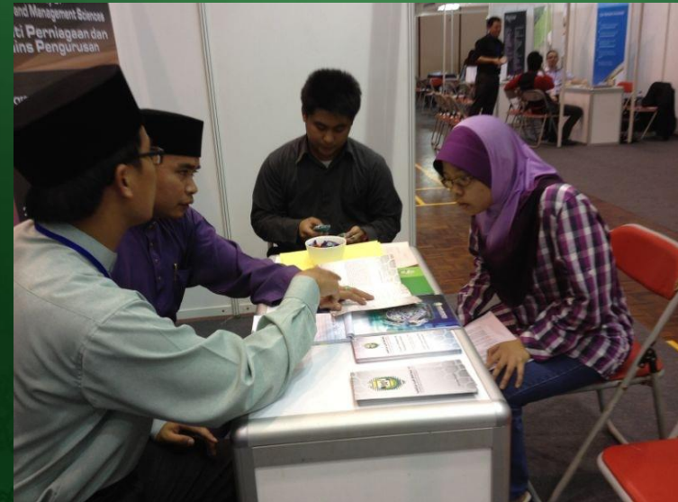
Dewan Muhibbah, Berakas