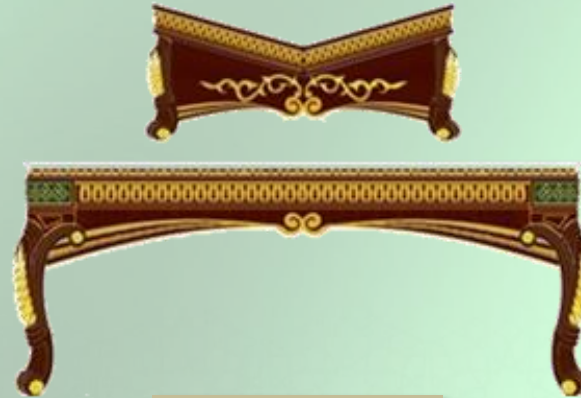
Meja & Rehal