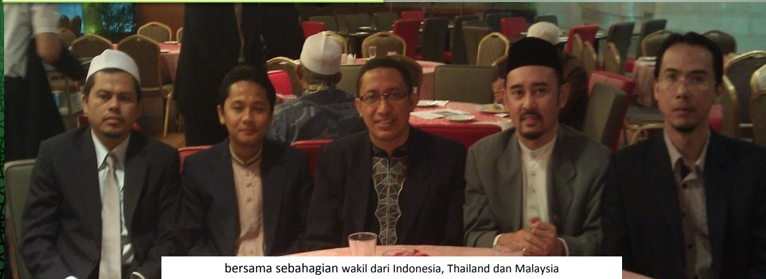
bersama sebahagian wakil dari Indonesia, Thailand dan Malaysia