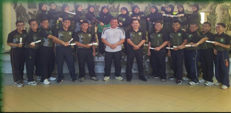
Kursus Kawad Kaki dan Solat Khauf 11/12/2012 – 14/12/2012, Rimba Kem