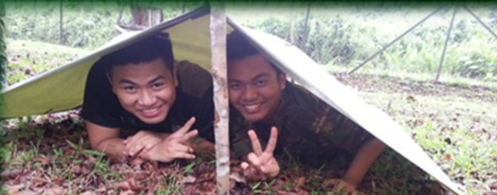
Memasang Juli 17/04/2013 Rimba Kem