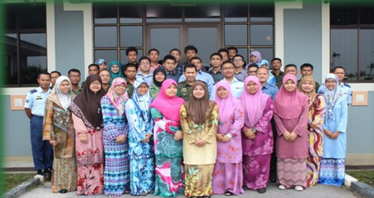
Eksplorasi Motivasi Kendiri 24/09/2012 – 26/09/2012 Bolkiah Kem