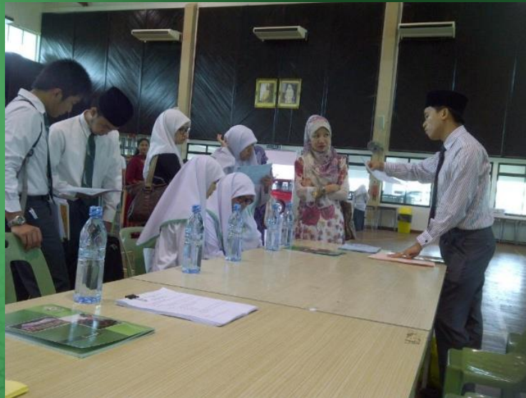
Sekolah Menengah Sayyidina Ali, Kuala Belait