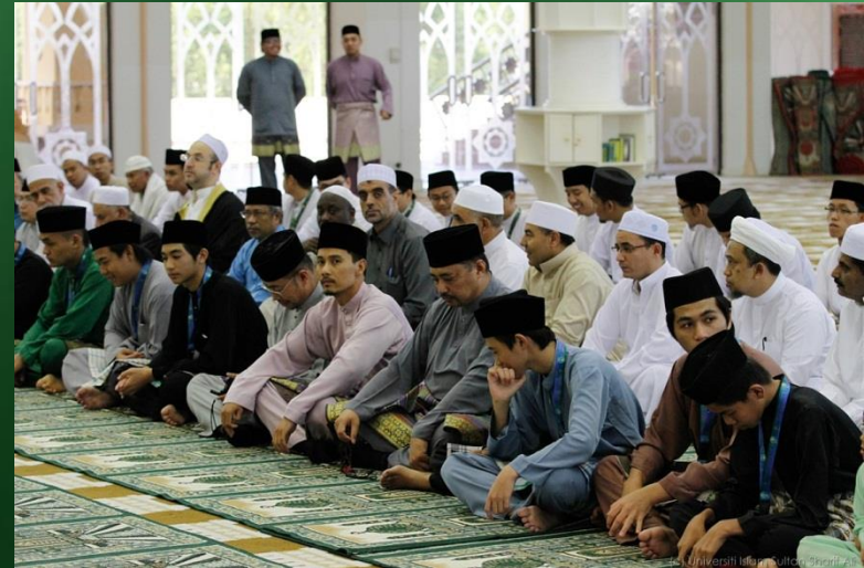
Qiamullail dan Solat Sunat Berjemaah, Solat Subuh Berjemaah dan Kuliah Subuh