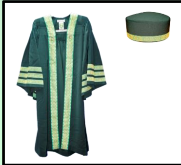
Graduan Doktor Falsafah tiga turus

Bilangan sulaman turus di sekeliling lengan adalah bagi membezakan tahap kelulusan masing-masing