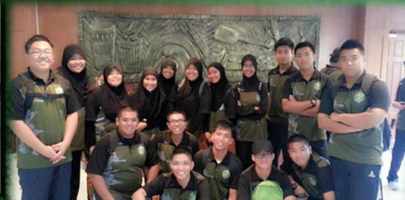
Lawatan PKT UNISSA ke UMS, 18/12/2012 – 21/12/2012 Kota Kinabalu, Sabah