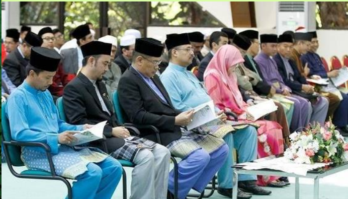
Majlis Pembukaan Rasmi