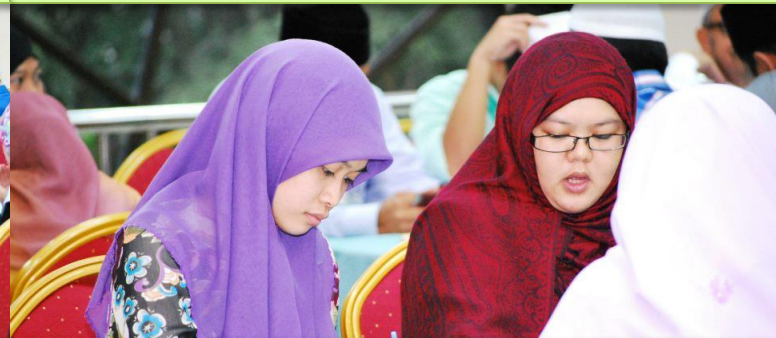
Sebahagian daripada pelajar yang mendapatkan penjelasan mengenai program yang ditawarkan di Fakulti Bahasa Arab dan Tamadun Islam