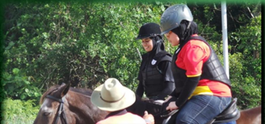
Menunggang kuda 03/04/2013, Saddle Club Berakas Kem