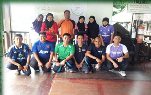
Hiking Bukit Shahbandar 30/01/2013 Bukit Shahbandar