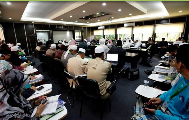
Salah satu sesi pembentangan kertaskerja