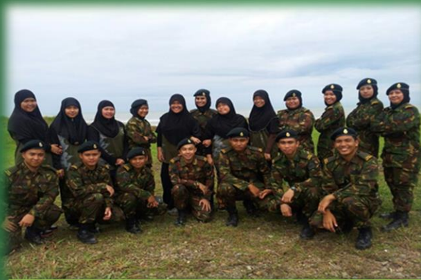
Latihan Kederasan Peluru 11/01/2013 Penanjong Kem, Tutong