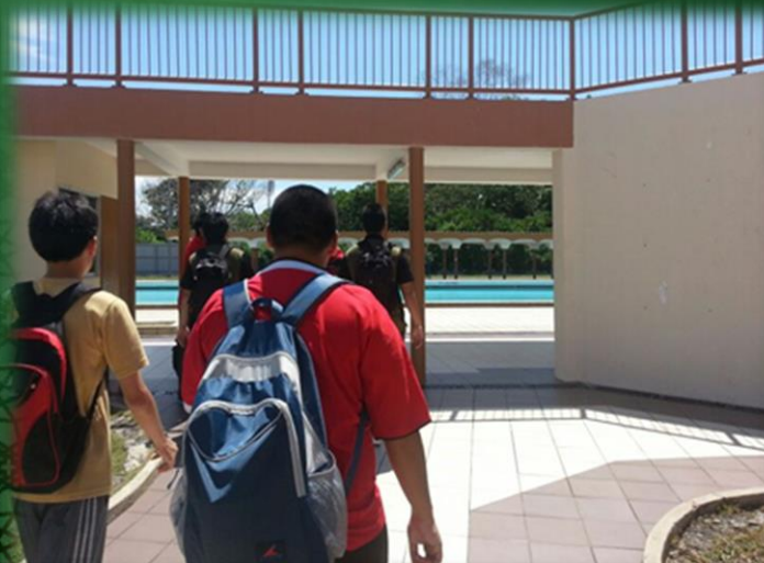
Latihan Berenang 03/04/2013 Kolam Renang Berakas Kem