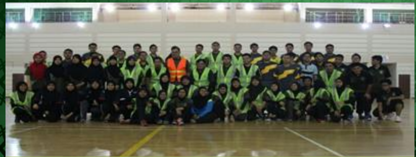
Perlawanan Futsal dan Netball, 18/05/2013, UBD Sports Complex