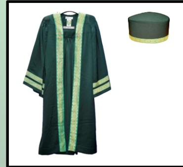
Graduan Ijazah Sarjana dua turus