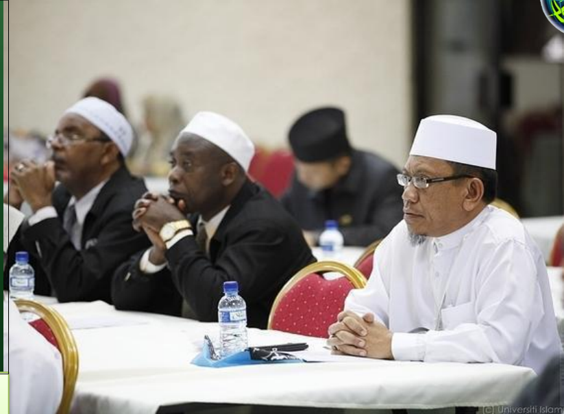
Sebahagian peserta persidangan.