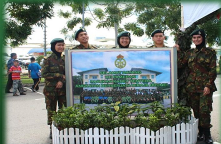
Hari Ulang Tahun Angkatan Bersenjata Diraja Brunei 01/06/2013 Bolkiah Kem