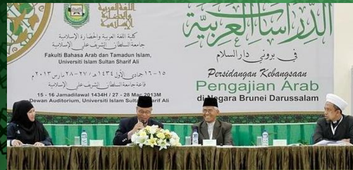
Sesi pembentangan kertas kerja