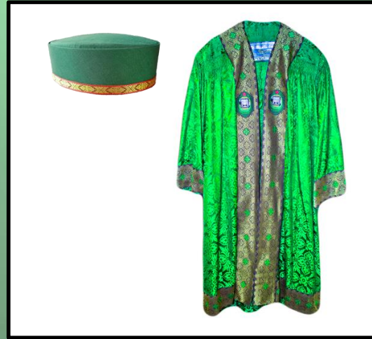
Timbalan Pengerusi Majlis