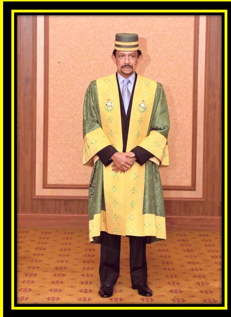
KEBAWAH DULI YANG MAHA MULIA PADUKA SERI BAGINDA SULTAN HAJI HASSANAL BOLKIAH MU'IZZADDIN WADDAULAH IBNI AL-MARHUM SULTAN HAJI OMAR 'ALI SAIFUDDIEN SA'ADUL KHAIRI WADDIEN, SULTAN DAN YANG DI-PERTUAN NEGARA BRUNEI DARUSSALAM