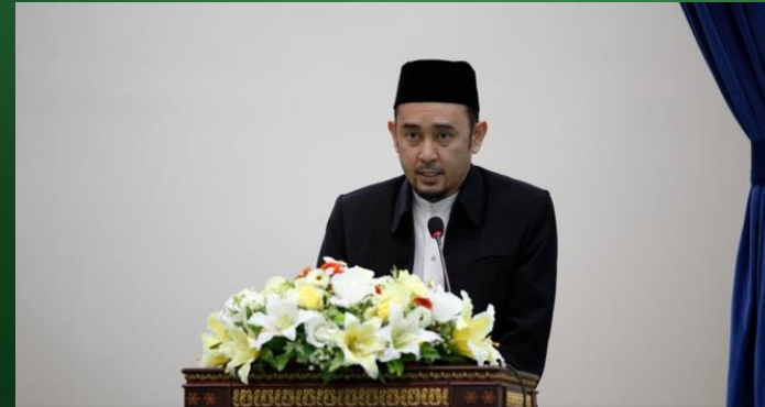
Taklimat mengenai Fakulti Bahasa Arab dan Tamadun Islam