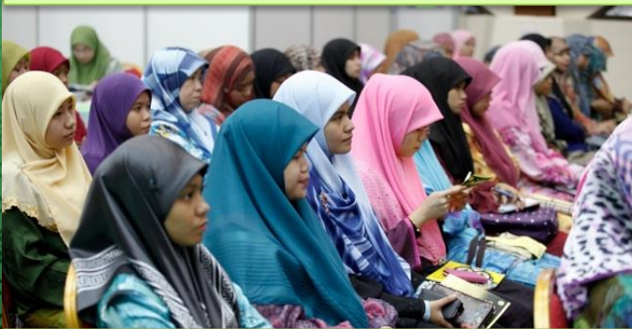
Di antara lepasan pelajar pra-universiti yang berminat untuk mengunjungi booth Fakulti Bahasa Arab dan Tamadun Islam