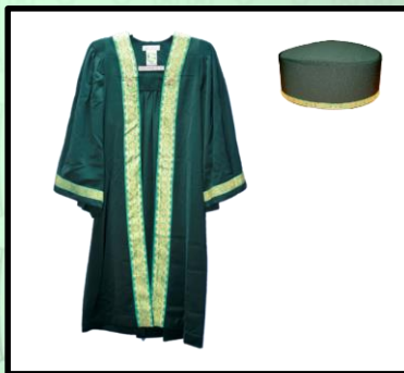
Graduan Ijazah Sarjana Muda satu turus