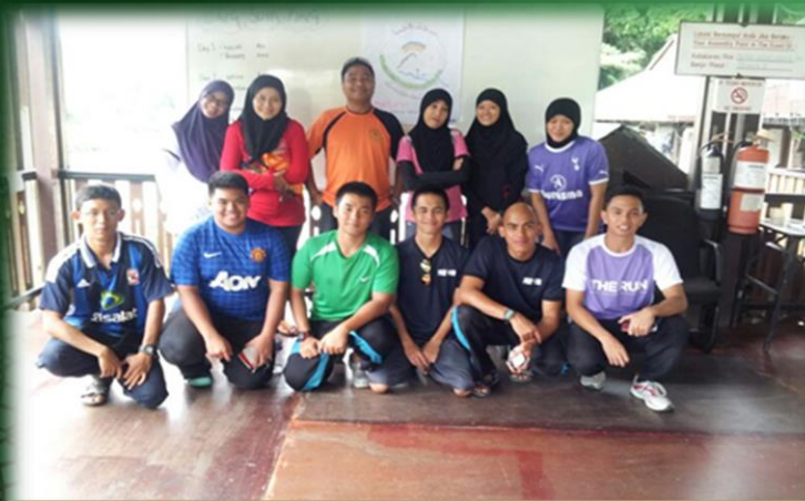
Sekapur Sireh, Outward Bound Brunei Darussalam 02/07/2013 – 04/07/2013 Temburong