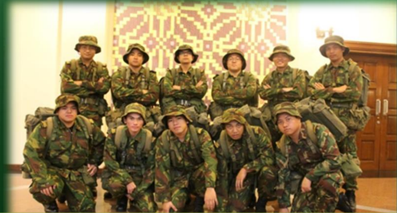
Persembahan Solat Khauf Sempena HafI Takharrij yang ke-2, 31/10/2012 Pusat Persidangan Antarabangsa