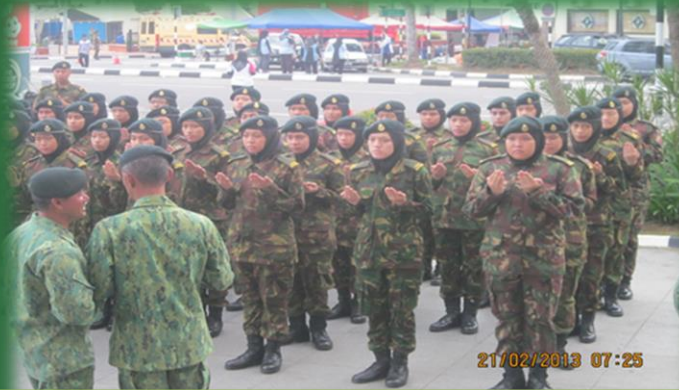
Perbarisan Lalu Sempena Hari Kebangsaan Negara Brunei Darussalam ke-29 23/02/2013, Taman Sir Muda Omar Ali Saifuddien