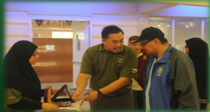
PKT UNISSA A ( Johan bola jaring) PKT UNISSA A (Tempat kedua futsal)