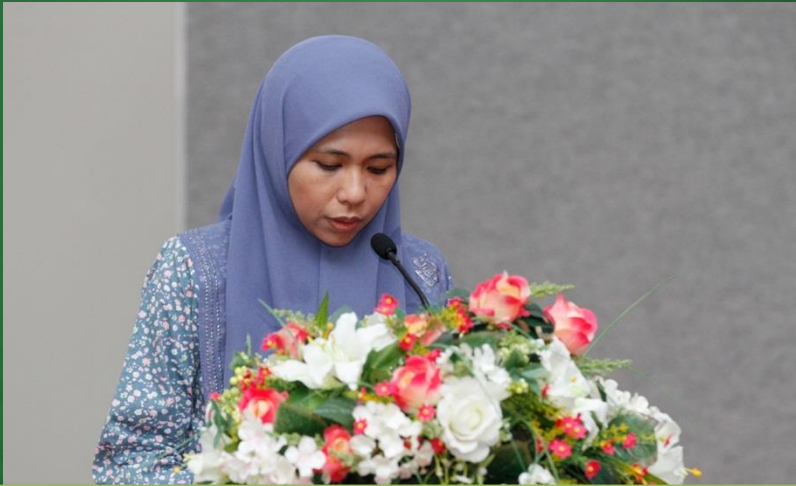
Ucapan alu-aluan oleh Dekan Pelajar

MAJLIS SAMBUTAN AWAL TAHUN HIJRAH 1434, Penyampaian Hadiah Peraduan Sempena Mahrajan HafI Al-Takharruj Ke-2 dan Penyampaian Insentif Kepada Mahasiswa/i Yang Mengharumkan Nama UNISSA, 24 November 2012, Pusat Persidangan Antarabangsa Berakas